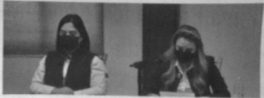
Síndicos y Regidores del Municipio de Apodaca invitan a la ciudadanía para la próxima entrega de la Medalla al Mérito Cívico Profr. Moisés Sáenz Garza

deporte, actividad pública y social. Los interesados pueden inscribir a sus candidatos en la Presidencia Municipal a partir del próximo 14 de febrero y hasta el 7 de marzo, en horarios de 8:00 a 17:00 horas, de lunes a viernes.