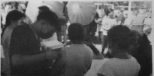
La salud es una de las áreas más importantes en la que la Administración Pública Juarense está trabajando.