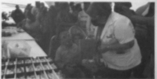
Niños, jóvenes y adultos pudieron acceder a este importante beneficio que presta la administración pública.