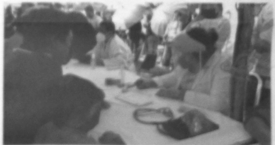
Se atiende a todos por igual brindando un servicio de Buena Calidad.

Se informó que estas brigadas médico-educativas son llevadas semanalmente a diferentes puntos del municipio, para que sean aprovechadas por los habitantes de todas las colonias de Juárez.