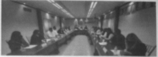
Tomando las mejores decisiones que benefician al Municipio aparece el Cabildo Apodaquense.